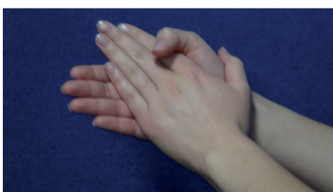
Handflächen und -gelenke