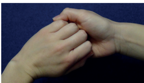
Außenseiten der Finger