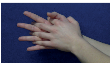
Zwischen den Fingern